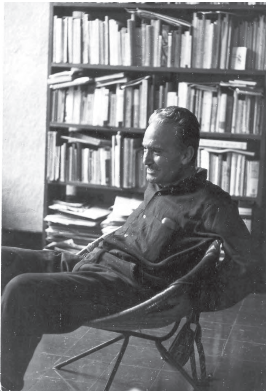
José María Arguedas en casa de Chaclacayo.

Sus estudios de primaria los realizó en San Juan de Lucanas, Puquio y Abancay, y los de secundaria en Ica, Huancayo y Lima. Ingresó a la Facultad de Letras de la Universidad de San Marcos, en 1931, estudió Literatura y después Etnología.