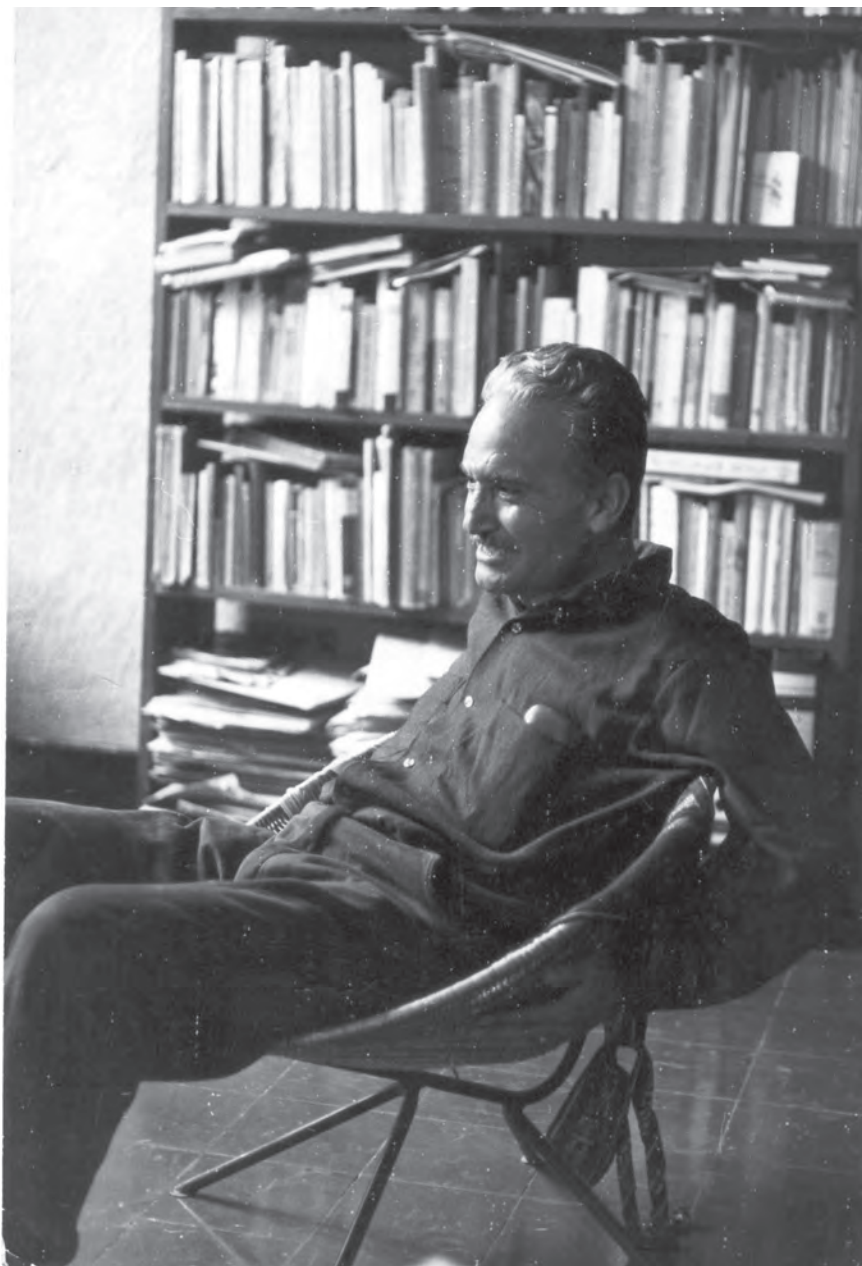
José María Arguedas en casa de Chaclacayo.

Sus estudios de primaria los realizó en San Juan de Lucanas, Puquio y Abancay, y los de secundaria en Ica, Huancayo y Lima. Ingresó a la Facultad de Letras de la Universidad de San Marcos, en 1931, estudió Literatura y después Etnología.