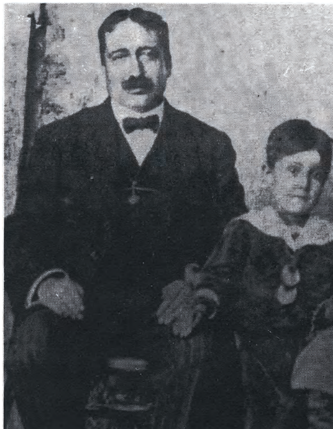
José María Arguedas con su padre en 1916.

E n este artículo me he propuesto escribir sobre José María Arguedas, tratar de llegar al lado más sensible y humano en él, para poder entender sus obras. Para ello, hablaremos sobre su vida, sobre qué pensaba de las personas indígenas y de diversas clases sociales, y sobre la época en que estuvo en prisión, contada años después en la novela El Sexto . Estos tres aspectos están muy relacionados.