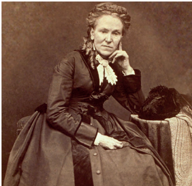
Retrato de Matilda Joslyn Gage, 1871.

E 1 efecto Matilda es un prejuicio en contra de reconocer los logros de las mujeres científicas, que llevó a que sus trabajos a menudo se consideraran como logros de sus colegas hombres. En 1993, la investigadora Margaret W. Rossiter denunció la situación que vivían las científicas, a la que denominó “efecto Matilda”, en homenaje a Matilda Joslyn Gage, activista que luchó por los derechos de las mujeres. 4