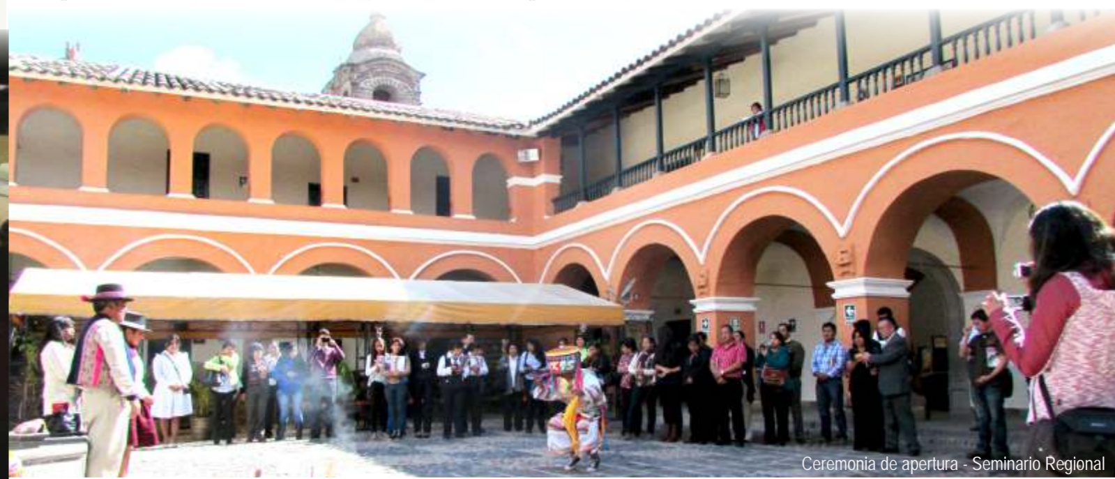
Ceremonia de apertura - Seminario Regional

Fue un trabajo arduo, pero satisfactorio, fue una oportunidad para contribuir a la implementación de la primera política del Proyecto Educativo Regional (PER): EIB para todas y todos.