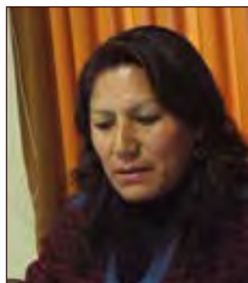
TAREA / RH