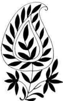
Siglo XX, Luconow, India

Tarea, Asociación de Publicaciones Educativas. Parque Osoros (antes Parque Borgoño) N° 161, Pueblo Libre, Lima 21. Apartado Postal 2234, Lima 100, PERÚ (Telefax 240997).