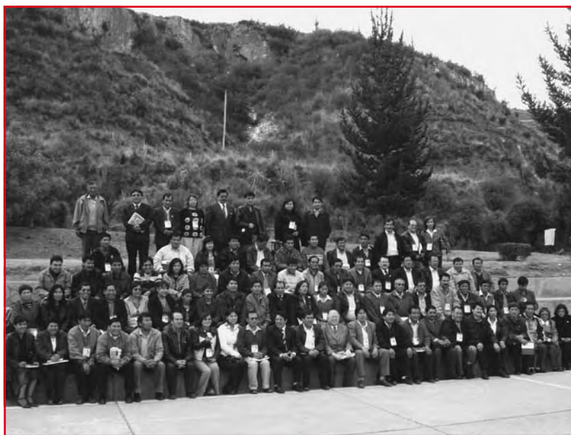
El Primer Congreso Regional de COPALE reunió a representantes de la sociedad civil y gestores educativos de las trece provincias de la Región Cusco.

Ahora hay que convertir estos deseos en realidades. Para valorarlos