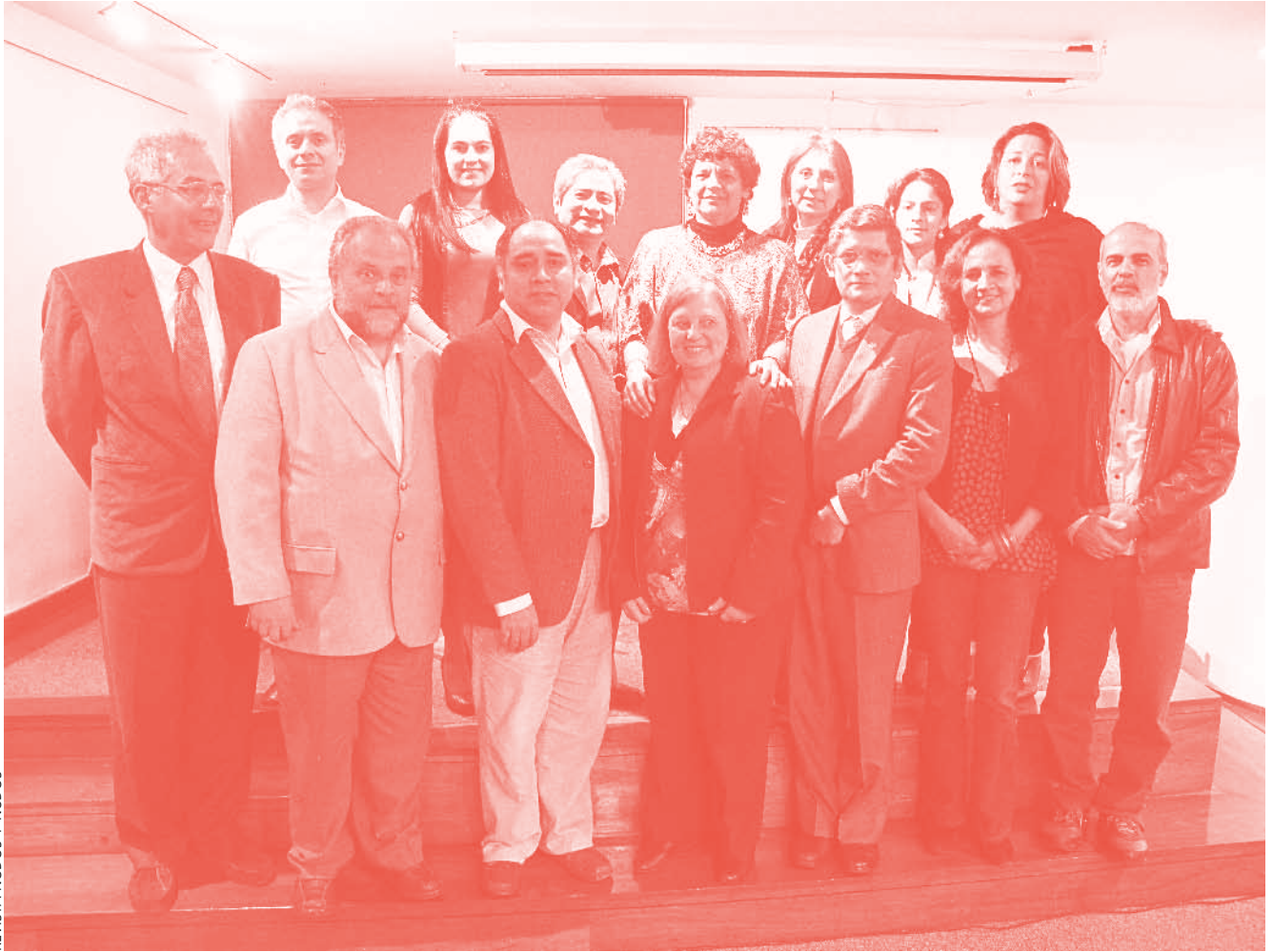
REVISTA NODOS Y NUDOS

configurar una red internacional de publicaciones que permita sostener este tipo de impresos y discutir sobre el impacto de los procesos de indexación de nuestras revistas para su fortalecimiento.